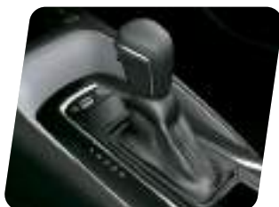
Transmisión CVT secuencial de 10 velocidades (*)