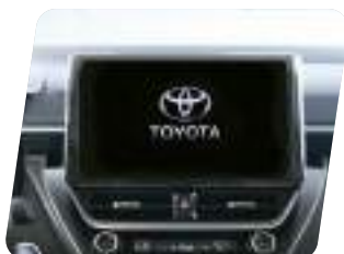
Sistema de audio touchscreen 8" con 6 parlantes