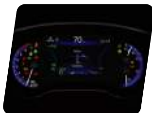
Panel multi-información de 4.2" TFT (Thin Film Transistor)