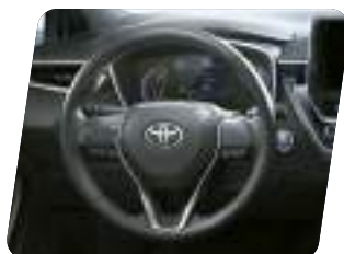
Timón de uretano de 3 rayos con controles de función