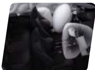
Airbags: Piloto, copiloto, laterales, cortinas y rodilla (piloto)