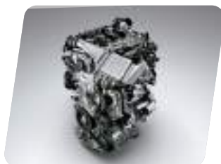
Motor de 1.2 L Dual VVT-i con potencia de 114 hp