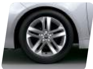
Aros de aleación de 16"