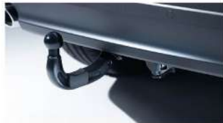
Remolque desplegable eléctrico