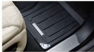
Juego de alfombras de goma